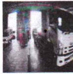
Foto Belakang Image Rear